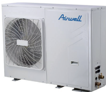
PAC BT 5-7 kW

à partir de 2055,00 € HT + 19,17 € HT d'éco-participation