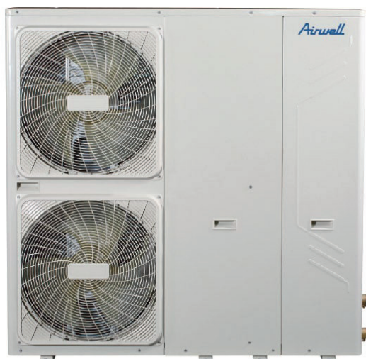
PAC BT 9-10-12-4-16 kW