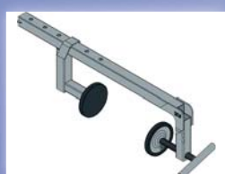
Support presse à patin