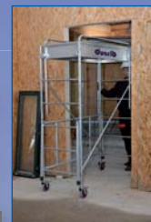
FUNCTION QUICK : passage des portes sans démontage des gardes corps

Longueur d'échafaudage 1m ou 1,50m - Largeur 0,62m - Echafaudage à montage et démontage en sécurité par 1 opérateur - Réglage de la hauteur de 2,30 à 3,80m - Base pliante pour mise en place rapide - Plancher alu/bois - Charge utile 150 kg - Décret N°2004-924 du 01/09/04 - Echelles munies de goupilles imperdables - Stabilisateurs intégrés à la base et à réglage millimétrique - Roues à frein Ø125mm.