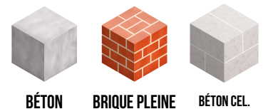
BÉTON BRIQUE PLEINE BÉTON CEL.