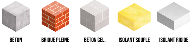
BÉTON BRIQUE PLEINE BÉTON CEL. ISOLANT SOUPLE ISOLANT RIGIDE