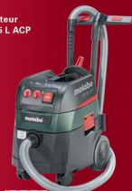
Aspirateur ASR 35 L ACP