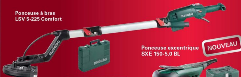
Ponceuse à bras LSV 5-225 Comfort