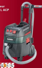
Aspirateur ASR 35 L ACP