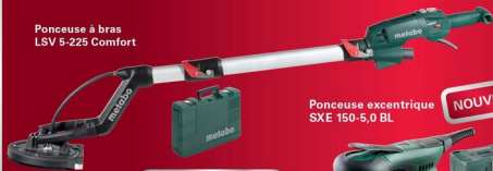
Ponceuse à bras LSV 5-225 Comfort