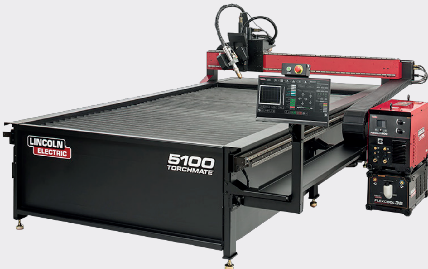
TABLE DE DECOUPE PLASMA

Photos non contractuelles - dans la limite des stocks disponibles - sous réserve d'erreurs typographiques - EDITION OCTOBRE 2021