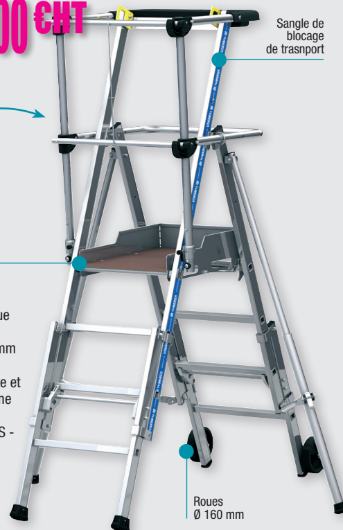
Plate-forme télescopique - Usage ultra intensif - Plateforme 600 x 420 mm équipée de plinthes h100mm - Antidérapante et grand confort - Conforme PIRL 93352 - Décret 2004.924 - Label NF/GS - Garantie 5 ans.

Dim. plate-forme 600 x 420 mm Plinthes hauteur 100 mm