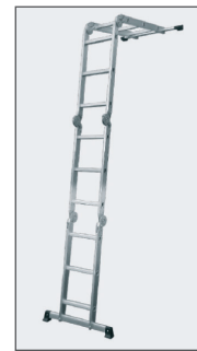
Position écarteur de mur